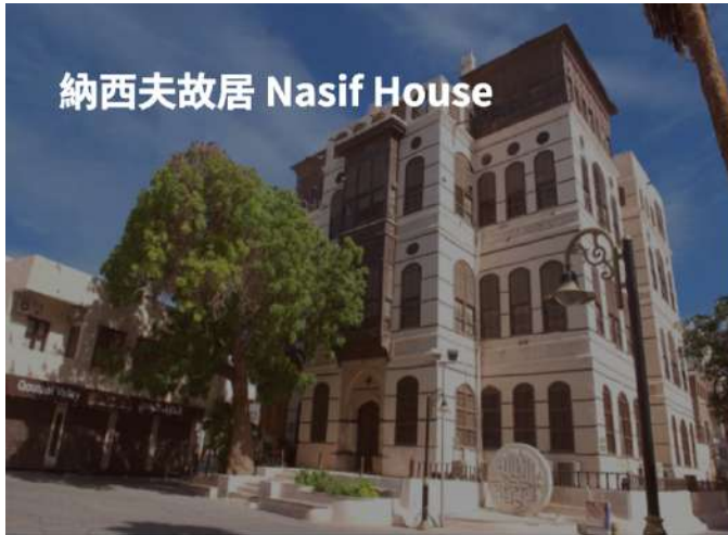
納西夫故居 Nasif House

【宿】：Parkinn Radisson Muscat 或 Grand Millennium 或 Intercity Hotel 或同級