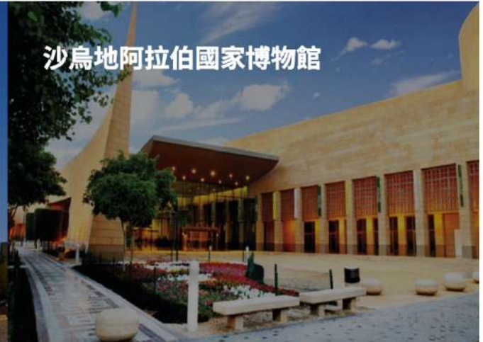
沙烏地阿拉伯國家博物館

首都利雅德市區觀光，參觀歷史重要地標的古蹟之一★穆斯馬克堡壘，此宮殿於 1895 年阿卜杜拉·本·拉希德統治期間建造的，建造這座宮殿的原因是，作為他的軍隊的駐軍。隨後前往★國家博物館，這個國家地標由八個畫廊組成，講述了從宇宙創造到現代時代的阿拉伯歷史的全部故事。★穆拉巴宮是 1937 年阿卜杜勒·阿齊茲國王建造的最重要的宮殿之一，宮殿有總統府、服務樓和國王宮殿所組成。這座宮殿僅採用當地建築材料，以當地傳統的納吉德風格建造。