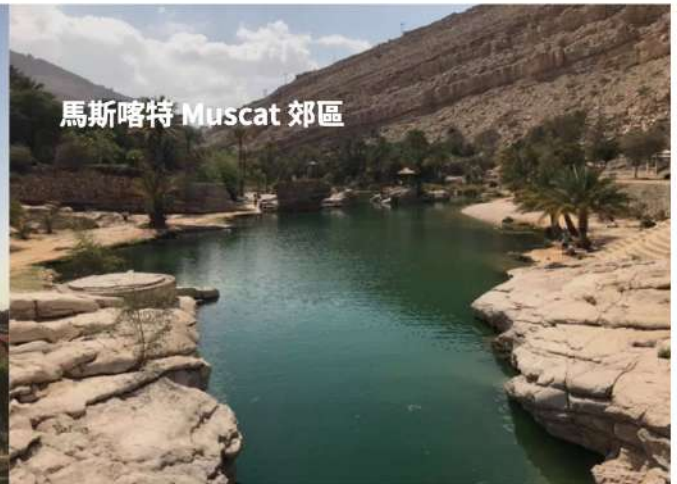
馬斯喀特 Muscat 郊區

馬斯開特是古老與現代的獨特融合，是一座美麗乾淨的城市，坐落在棕色百褶山之間，阿拉伯海環繞其間。今日遊覽▲大清真寺，祂是一個建築奇蹟，也是城市的地標，擁有壯觀的喚禮樓及圓頂。於皇家歌劇院稍事停留後隨即前往馬斯喀特老城區；城市最迷人的地方，▲Muttrah 露天市場，那裡有狹窄的小巷，那裡瀰漫著香料，咖啡。★Bait Al Zubair 國家博物館內擁有各種展覽品，是阿曼的遺產和文化資源。在宏偉的現任國王蘇丹氣派的 Al Aalam 皇宮旁邊是▲Mirani 和▲Jalali 的雙葡萄牙堡壘。午後前往蘇爾 (Sur)。在這條沿海岸公路上可欣賞阿拉伯海水域的美景及欣賞岩石峭壁，途中可欣賞石灰石火山口及風景如畫的瓦迪河谷。Qalhat 遺址是阿曼最古老的城鎮和海港之一。蘇爾具有重要的歷史意義，阿曼的許多有錢人都住在此地，沿途您會看到許