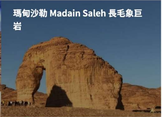
瑪甸沙勒 Madain Saleh 長毛象巨岩

📍★瑪甸沙勒是 2000 多年前拿巴底王國統治時期所留下的，她是世界文化遺產，被認為是世界上最迷人的文物遺址之一。它包含許多雕刻在岩石中的墓葬，具有高度裝飾性的外觀。Nabatean 銘文是亞述人印記的組合（在墳墓上部雕刻的陽台上看到），埃及裝飾和希臘風格在立面的其餘部分。大多數墳墓的入口上方都有銘文，上面寫著埋葬在那裡的人的名字以及有權埋葬在那裡的人的名字。他們還給出了雕刻的日期，雕刻師的名字和其他重要信息。現今所遺留下的著名墓區一由山岩巨石挖鑿雕刻出來的，其壯觀可與北邊的約旦佩特拉相媲美。今日前往沙漠巡遊，沿途可欣賞荒漠、火山、鄉村景觀於夕陽中登上▲長毛象巨岩。午後專車前往回教第二大聖城麥迪娜。西元 622 年，先知穆罕默德在麥加受當地人排擠迫害而被迫遷徙來麥迪娜，並在這裡建立最早的伊斯蘭教政權（烏瑪），麥迪那遂成為穆斯林國家的第一個首都。穆斯林們曾冠以“被照亮之城”、“和平之城”、“勝利之城”等美名。