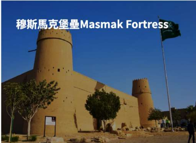
穆斯馬克堡壘 Masmak Fortress