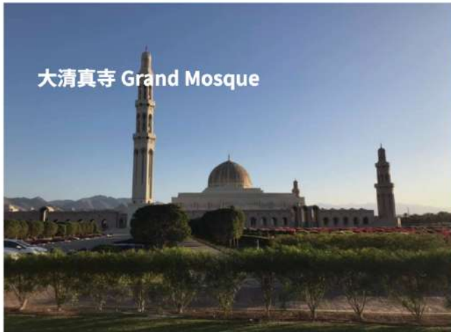
大清真寺 Grand Mosque